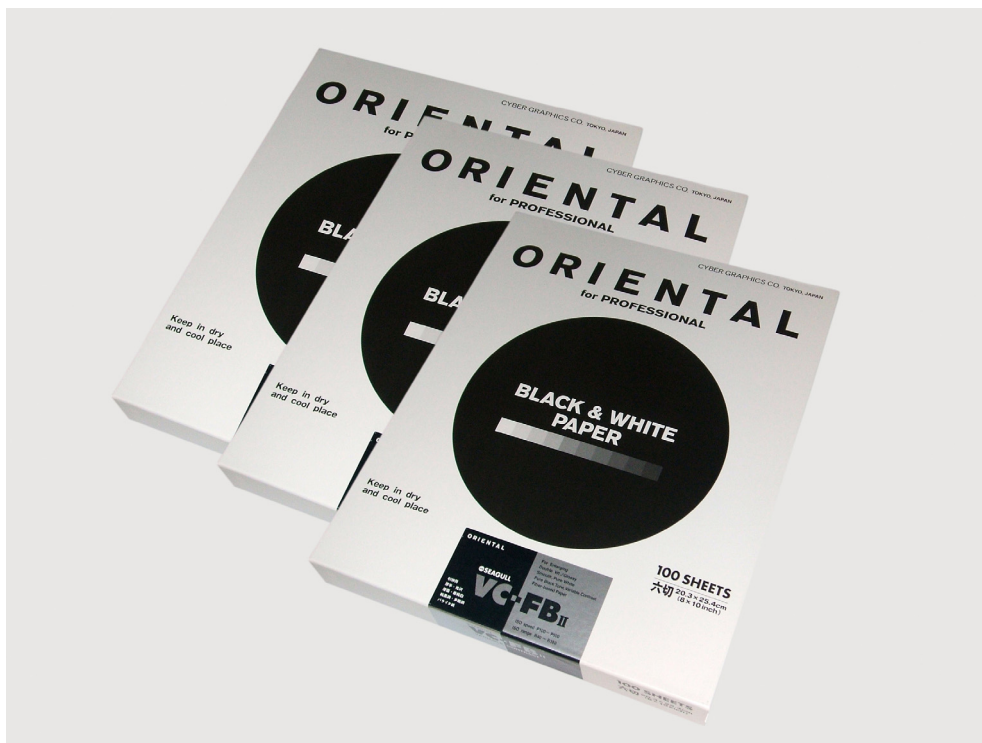
FOTO-R3.com importa directamente desde Japón, el mítico papel baritado de doble peso, Oriental New Seagull , en su versión de contraste variable (multigrado), acabado en brillo y tono neutro.

El papel baritado de la marca Oriental, cuenta con un amplio renombre internacional, conocido por su mayoritario uso en el copiado de alta calidad, presente como soporte de la mejores colecciones de fotografía argéntica con referentes históricos del calibre de Ansel Adams o Brett Weston .