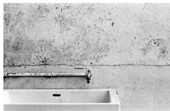
Copia a Color Copia Blanco y Negro

Rollei siempre sensible al contexto contemporáneo, sienta las bases de los criterios de conservación y archivo. Rollei CN 200 PRO DIGIBASE cuenta con una alta permanencia, facilita a su vez la transcripción de los datos analógicos en bancos de imágenes digitales de manera sencilla y sin pérdidas de calidad.